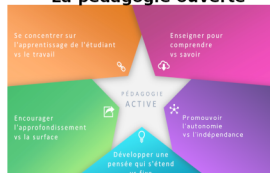
La pédagogie ouverte